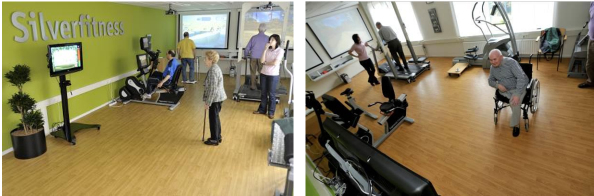
Senioren in beweging met de SilverFit in therapieruimtes

SilverFit is een Nederlands product, dat de afgelopen jaren speciaal is ontwikkeld om fysiotherapie voor ouderen te verbeteren. De kern wordt hierbij gevormd door de koppeling van bewegen met beeld. Bewegingen worden vertaald in activiteiten op een beeldscherm. Het systeem werkt met 3d camera technologie, waarmee de bewegingen van de speler uitgelezen kunnen worden. De persoon die beweegt, zit hiermee als het ware zelf in een computerspel. Dit blijkt zeer stimulerend voor betrokkenen om de fysiotherapie-oefeningen te doen. Dankzij de bijzondere technologie waar gebruik van wordt gemaakt, is het mogelijk om rekening te houden met individuele mogelijkheden. Zo is er van tevoren geen 'beweegtempo' ingesteld, maar bepaalt de gebruiker dat zelf. Doordat de gebruiker de beelden ziet, wordt hij wel meer uitgedaagd. Ook houdt het systeem rekening met iemands fysieke beperkingen. Door het interactieve karakter en de maatvoering blijkt er veel meer therapietrouw te zijn.