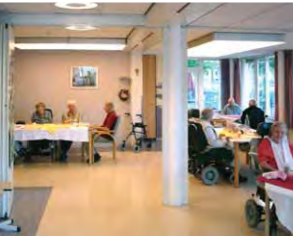
Een woonkamer in een verpleeghuis in Eindhoven, waar armaturen voor biologische stimulatie zijn opgehangen boven de eettafels.

lichtingssterkte, de spectrale samenstelling van het licht en de duur en timing van de lichtperiode. Het kantelpunt hierbij is het dagelijks minimum van de lichaamstemperatuur, enkele uren voor het opstaan [16]. Zo vervroegt licht in de ochtend de biologische klok-tijd, terwijl licht dat wordt toegediend voor het minimum van de lichaamstemperatuur, de biologische klok later stelt.